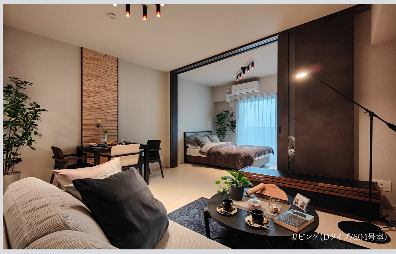
リビング (Dタイプ/804号室)

モデルルームやパンフレット、WEBサイトからでは想像しにくい設備仕様を实际にみて、触れて、ご覧いただけるので、設備の使い勝手や収納スペースの広さ、日々の暮らしの動線もより具体的にイメージすることができます。お料理のしやすいキッチンか、快適なバスルームか、建具やフローリング、クロスの色味は好みに合うか…実際にご確認いただくことで、よりご希望に沿った住まい選びが可能になります。