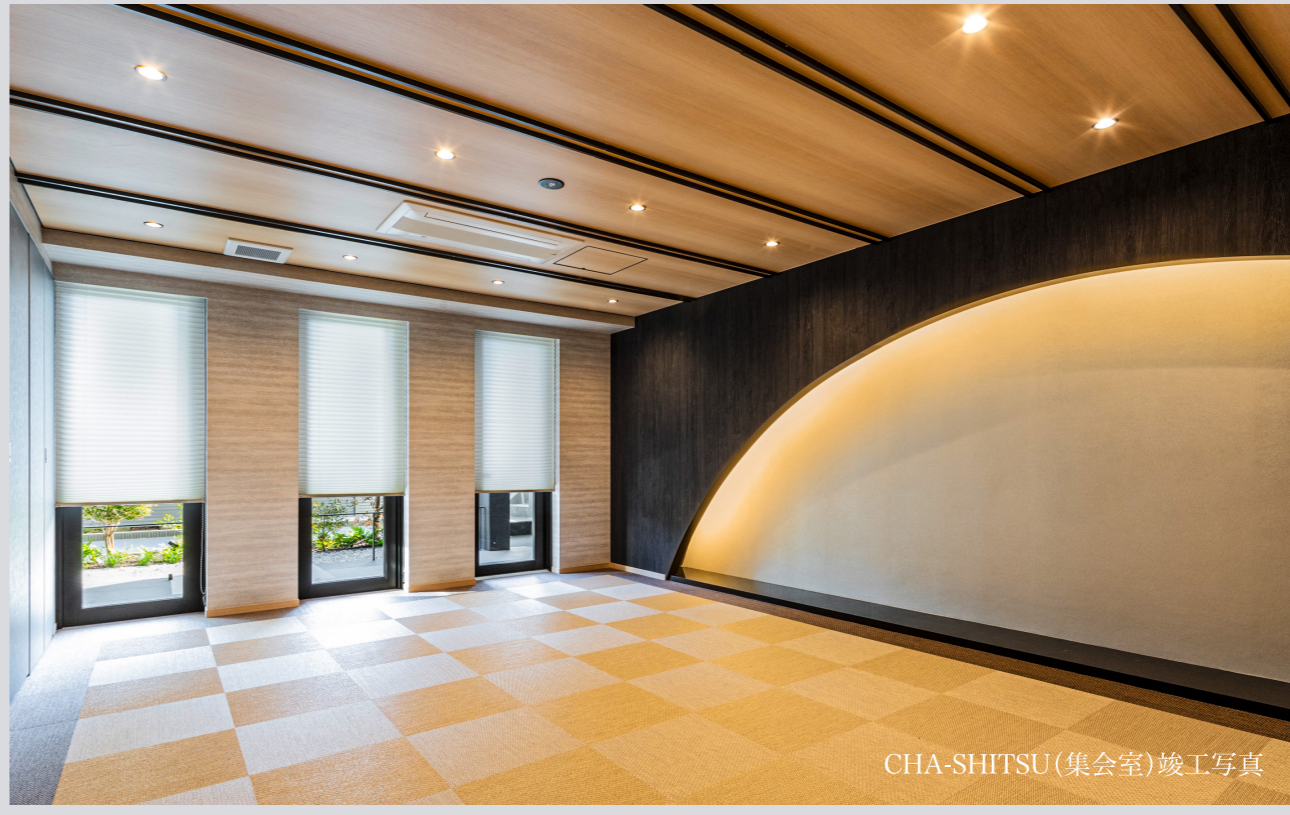
CHA-SHITSU (集合室) 竣工写真

竣工前は模型やCGパースなどでしか見られない外観や共用部のデザインや雰囲気を実際にご確認いただけます。ぜひ、周辺の街並みのなかに凛と佇む和モダンデザインレジデンス「ワザック西新井大師西」のグレードを感じながら、エントランスアプローチ～エントランス～エントランスホールへご希望の住戸までをご体感ください。これからの暮らしのイメージがより深まることでしょう。