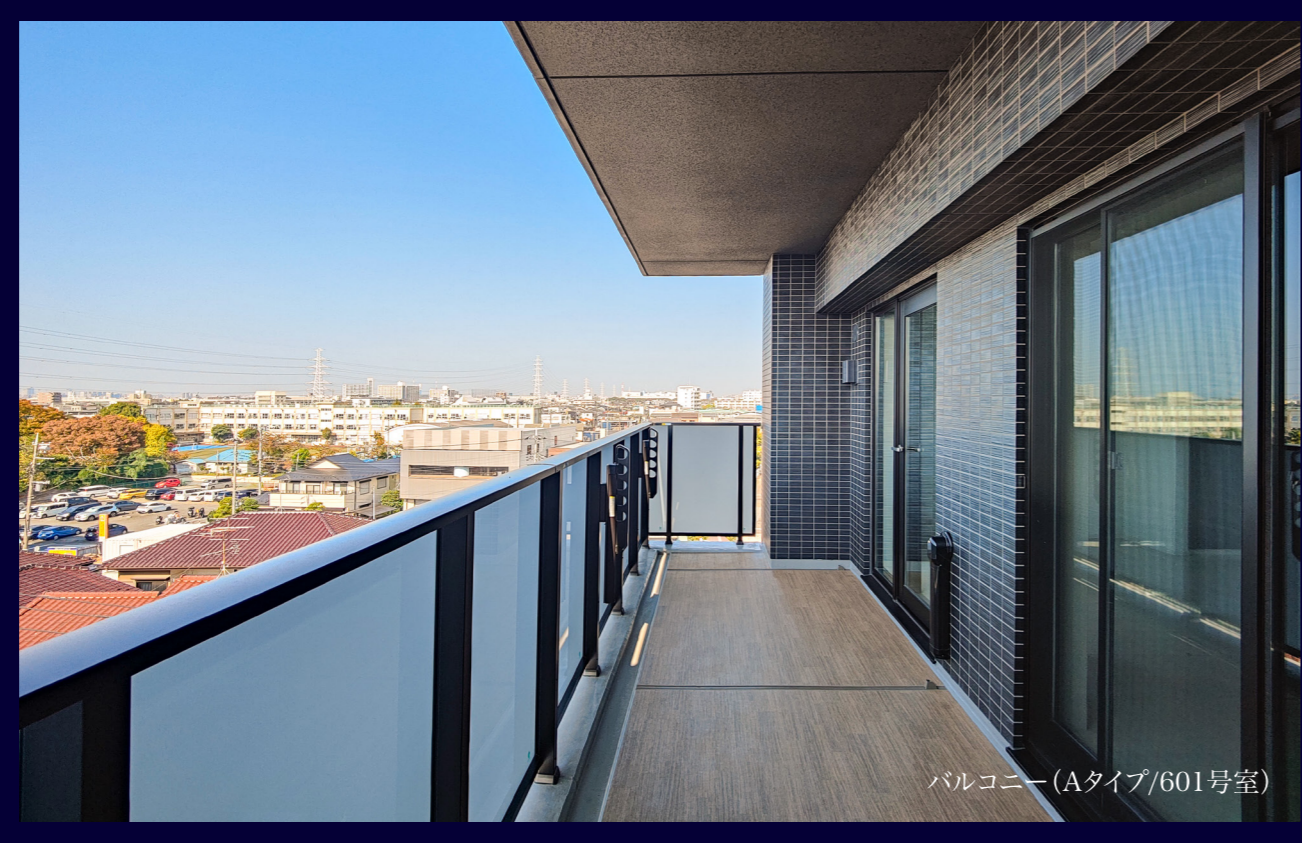
バルコニー (Aタイプ/601号室)