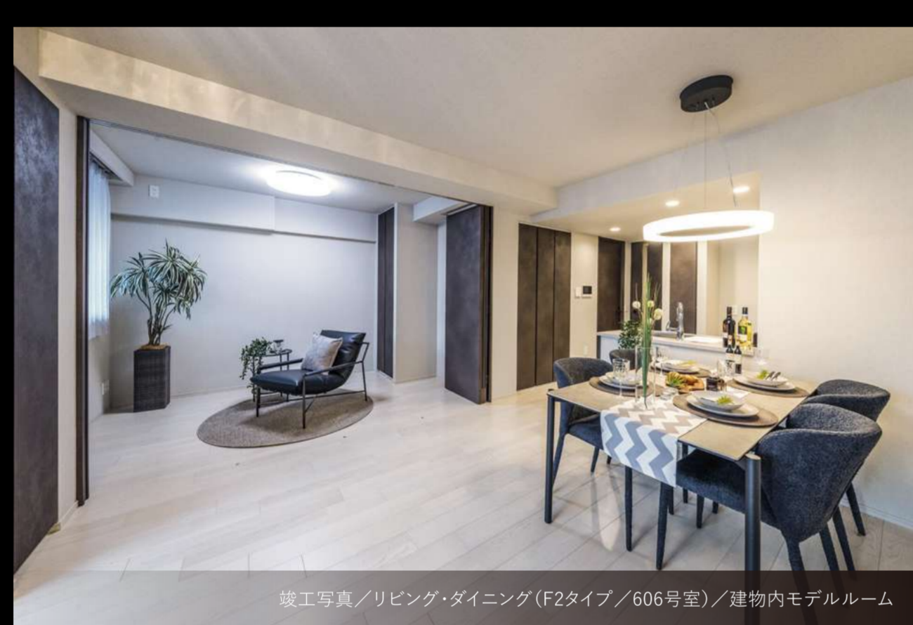
竣工写真/リビング・ダイニング(F2タイプ/606号室)/建物内モデルルーム