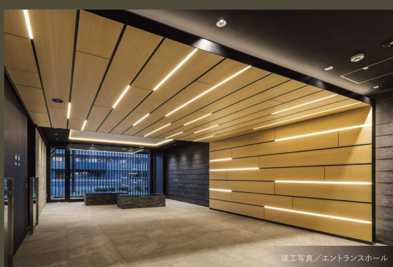
竣工写真/エントランスホール

竣工前は模型やCGパースなどでしか見られない外観や共用部のデザインや雰囲気を実際に確認いただけます。ぜひ、周辺の街並みのなかで凛と佇む和モダンデザインレジデンス「ワザック横濱新杉田」のグレード感を感じながら、エントランスアプローチ～エントランス～エントランスホールへご希望の住戸までをご体感ください。これからの暮らしのイメージがより深まることでしょう。