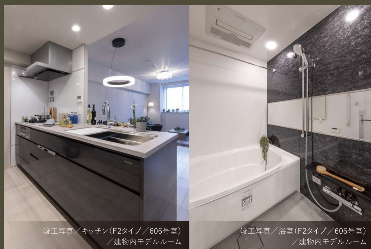
竣工写真/キッチン(F2タイプ/606号室)/建物内モデルルーム

モデルルームやパンフレット、WEBサイトからでは想像しにくい設備仕様を実際にみて、触れて、ご覧いただけるので、設備の使い勝手や収納スペースの広さ、日々の暮らしの動線もより具体的にイメージすることができます。お料理のしやすいキッチンか、快適なバスルームか、建具やフローリング、クロスの色味は好みに合うか…実際に確認いただくことで、よりご希望に沿った住まい選びが可能になります。