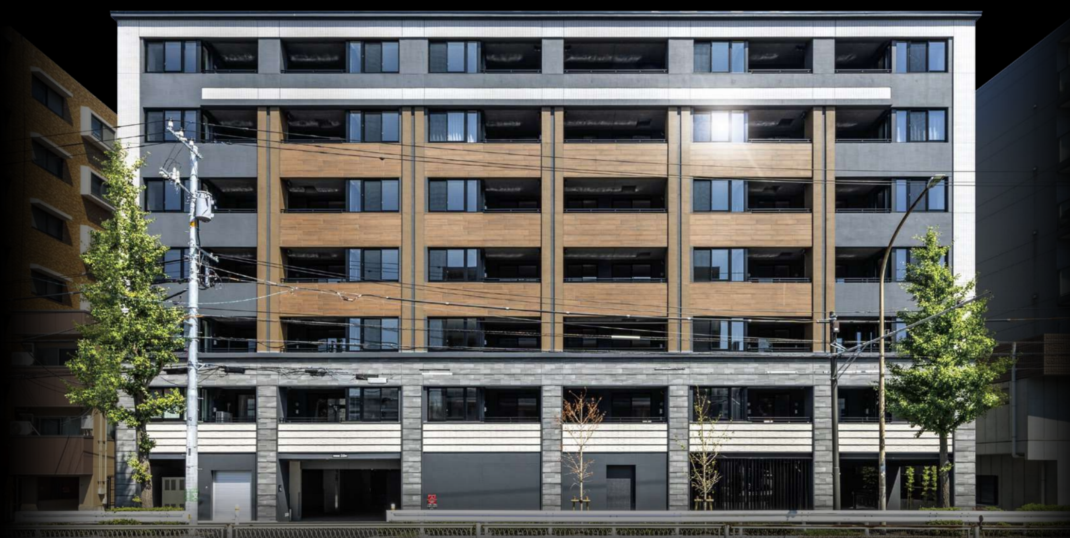
竣工写真/建物外観

「ワザック横濱新杉田」は完成済みの分譲マンションなので、 実際の建物やお部屋 をご確認いただけます。 また、完成物件ならではの 経済的・時間的なメリット もあります。