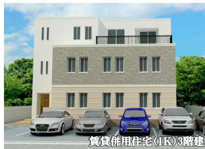
賃貸併用住宅(1K)3階建