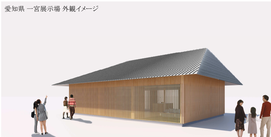
木の温もりが建物を包む軽やかで繊細な外観