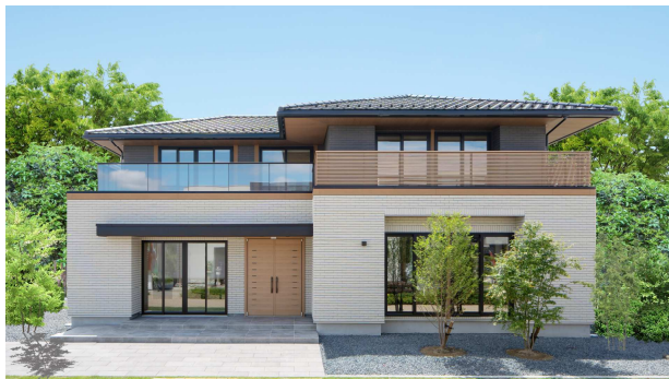
主力商品「日本の家・檜の家」シリーズ

今回は50周年に引き続き、日本の伝統技術や日本の住まいの特長(暮らしに合わせてフレキシブルに変化する空間や縦繁障子デザイン等)と素材は国産檜を活かし、繊細な美意識を取り入れた「和モダン」のモデルハウスを設計監修して頂きます。モデルハウスは、愛知県の一宮展示場(一宮市丹陽町)に建築、10月完成オープンに向けて計画を進めていきます。