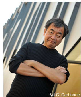
建築家 隈 研吾氏

1954年生。1990年、隈研吾建築都市設計事務所設立。慶應義塾大学教授、東京大学教授を経て、現在、東京大学特別教授・名誉教授。30を超える国々でプロジェクトが進行中。自然と技術と人間の新しい関係を切り開く建築を提案。主な著書に『全仕事』(大和書房)、『点・線・面』(岩波書店)、『負ける建築』(岩波書店)、『自然な建築』、『小さな建築』(岩波新書)、他多数。